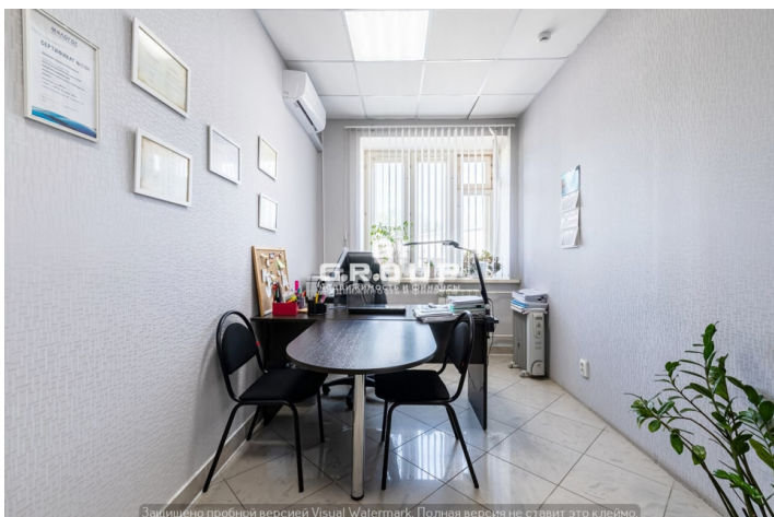
Защищено пробной версией Visual Watermark. Полная версия не ставит это клеймо.