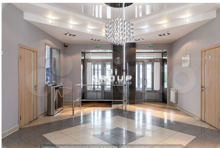
Защищено пробной версией Visual Watermark. Полная версия не ставит это клеймо.