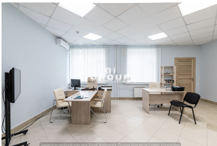
Защищено пробной версией Visual Watermark. Полная версия не ставит это клеймо.