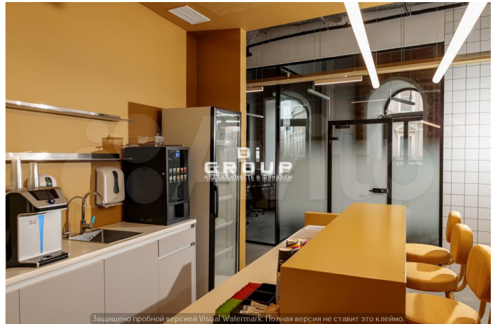
Защищено пробной версией Visual Watermark. Полная версия не ставит это клеймо.