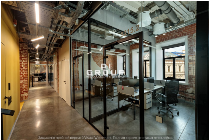
Защищено пробной версией Visual Watermark. Полная версия не ставит это клеймо.