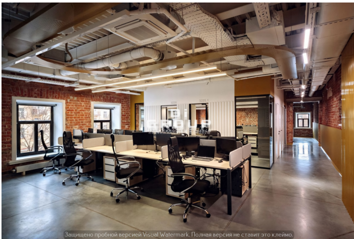
Защищено пробной версией Visual Watermark. Полная версия не ставит это клеймо.