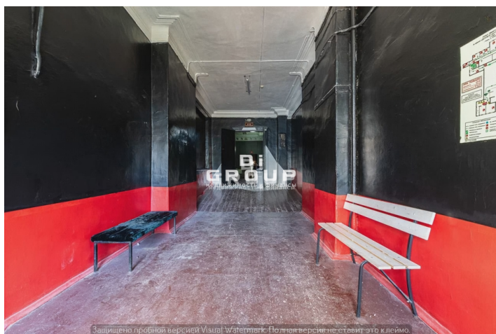
Защищено пробной версией Visual Watermark. Полная версия не ставит это к/лемо.