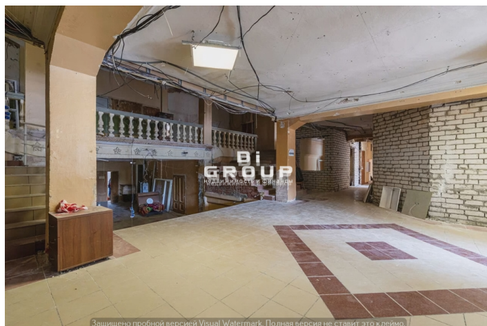
Защищено пробной версией Visual Watermark. Полная версия не ставит это к/лемо.