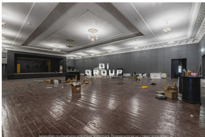
Защищено пробной версией Visual Watermark. Полная версия не ставит это к/лемо.