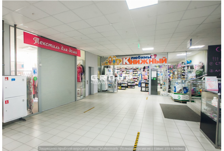
Защищено пробной версией Visual Watermark. Полная версия не ставит это клеймо.