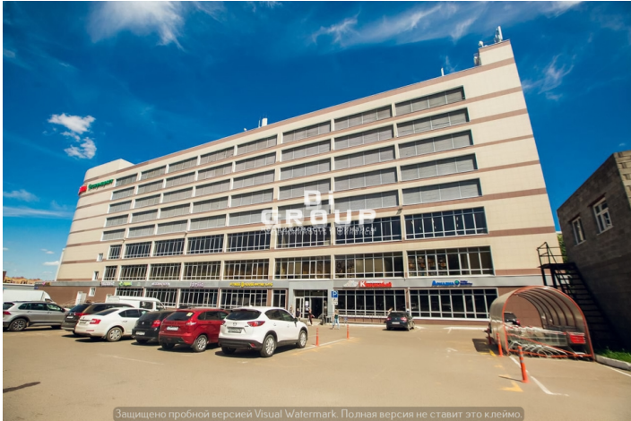
Защищено пробной версией Visual Watermark. Полная версия не ставит это клеймо.