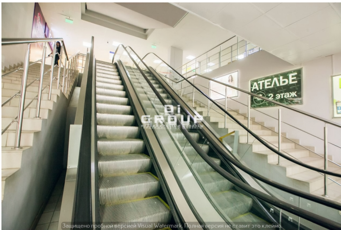
Защищено пробной версией Visual Watermark. Полная версия не ставит это клеймо.