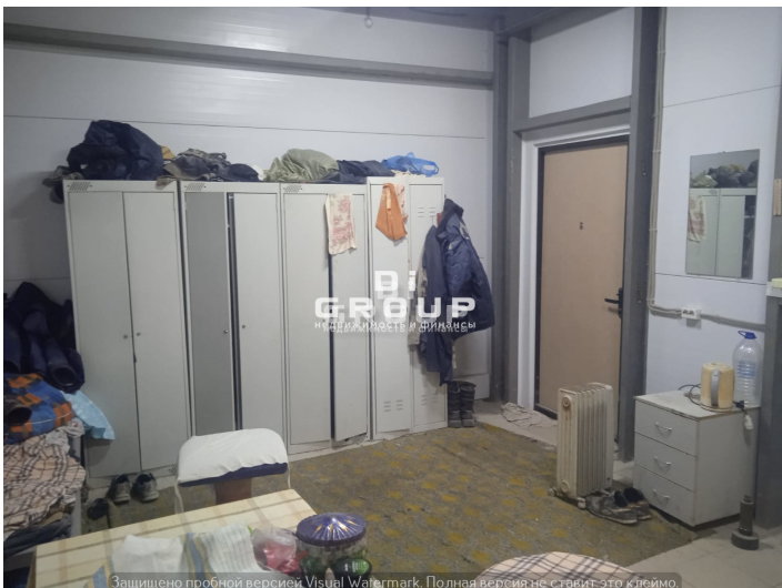
Защищено пробной версией Visual Watermark. Полная версия не ставит это клеймо.