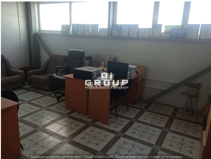
Защищено пробной версией Visual Watermark. Полная версия не ставит это клеймо.