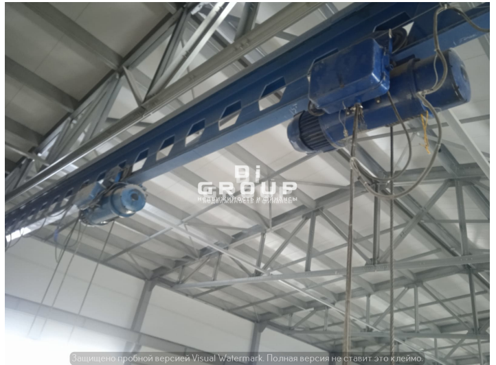
Защищено пробной версией Visual Watermark. Полная версия не ставит это клеймо.