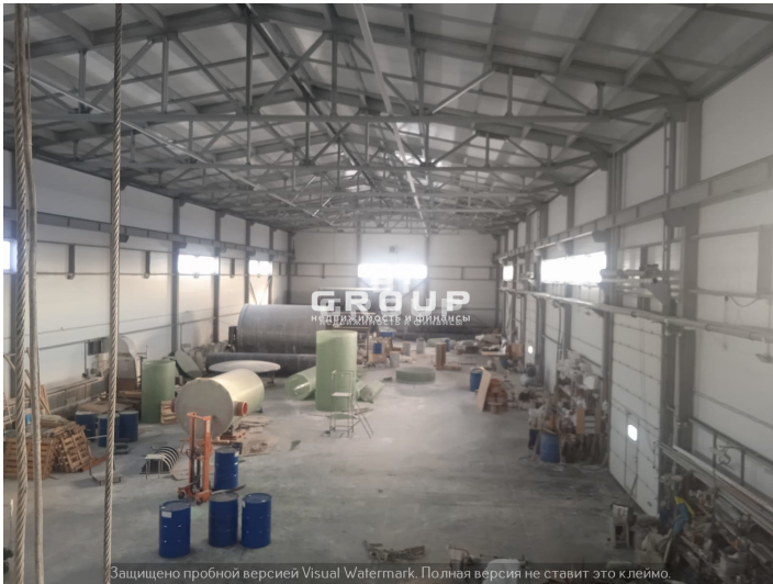
Защищено пробной версией Visual Watermark. Полная версия не ставит это клеймо.