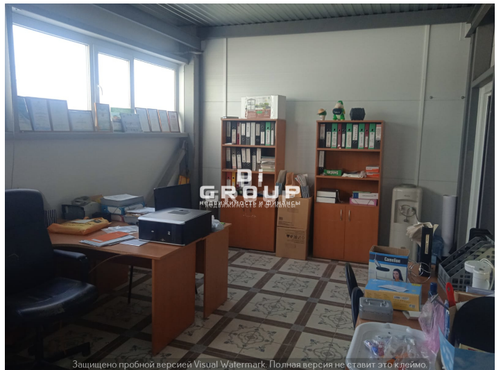
Защищено пробной версией Visual Watermark. Полная версия не ставит это клеймо.