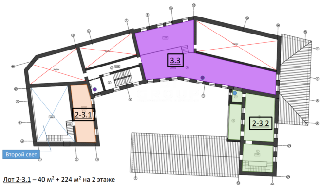
Предполагаемые лоты 3 этажа

Лот 2-3.1 – 40 м 2 + 224 м 2 на 2 этаже Лот 2-3.2 – 105 м 2 + 467 м 2 на 2 этаже Лот 3.3 – 84 м 2