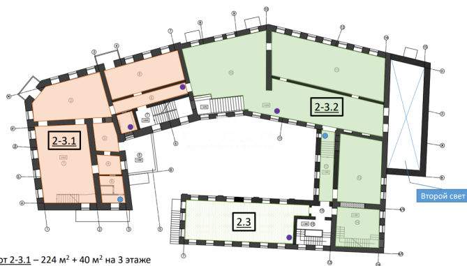
Предполагаемые лоты 2 этажа

Лот 2-3.1 – 224 м 2 + 40 м 2 на 3 этаже Лот 2-3.2 – 467 м 2 + 105 м 2 на 3 этаже Лот 2.3 – 84 м 2