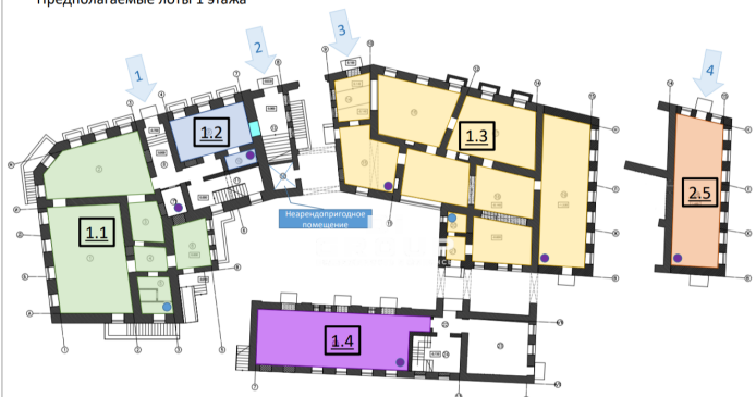
Предполагаемые лоты 1 этажа

Лот 1.1 – 176 м 2 Лот 1.2 – 36 м 2 Лот 1.3 – 286 м 2 Лот 1.4 – 67 м 2 Лот 2.5 – 84 м 2