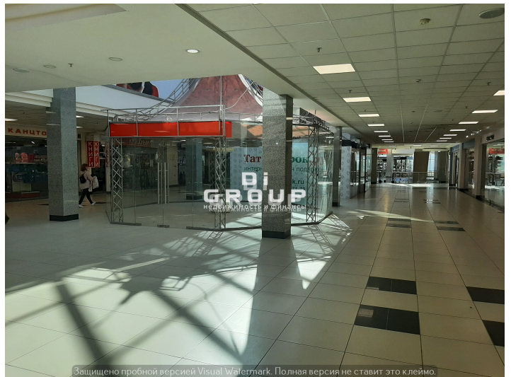
Защищено пробной версией Visual Watermark. Полная версия не ставит это клеймо.