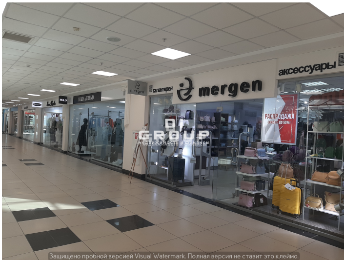
Защищено пробной версией Visual Watermark. Полная версия не ставит это клеймо.