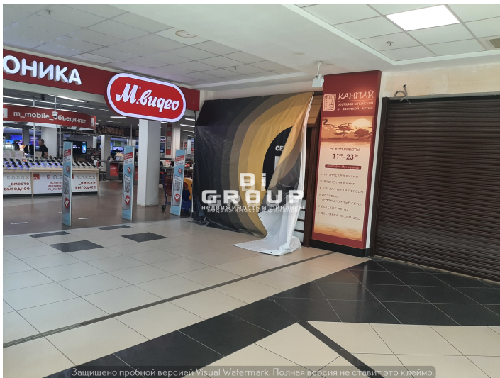
Защищено пробной версией Visual Watermark. Полная версия не ставит это клеймо.