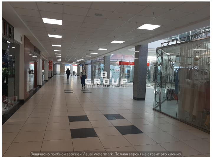
Защищено пробной версией Visual Watermark. Полная версия не ставит это клеймо.