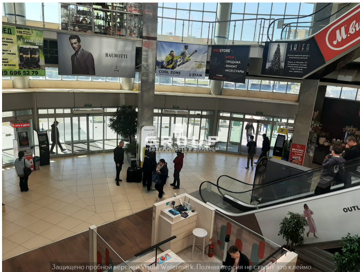
Защищено пробной версией Visual Watermark. Полная версия не ставит это клеймо.