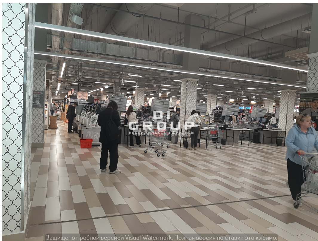
Защищено пробной версией Visual Watermark. Полная версия не ставит это клеймо.