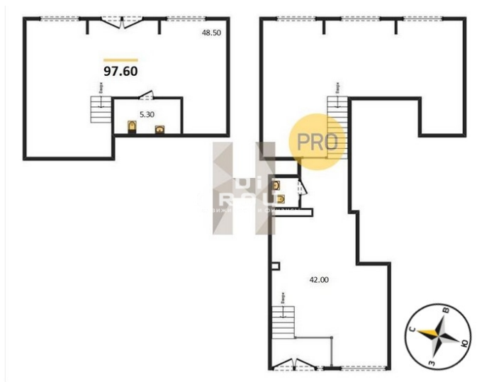
КОРПУС 1 Секция 5 План 1 этажа